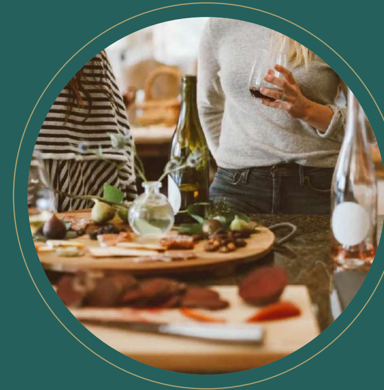
Aperitivo y picoteo