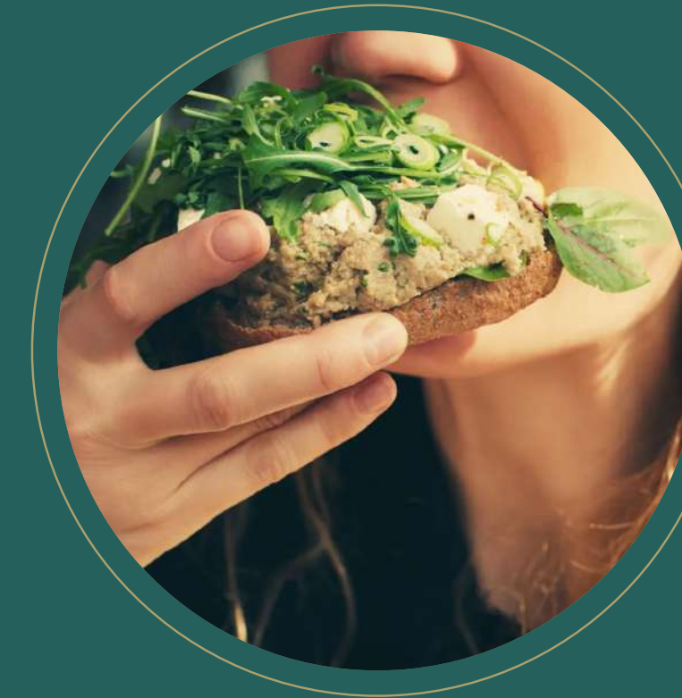
Snack - "Matahambre"