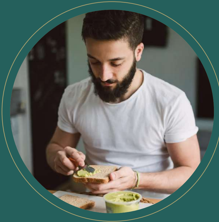
Tosta en desayuno